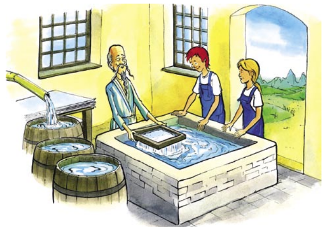
Obwohl sich das Prinzip seit fast 2.000 Jahren nicht verändert hat, ist die Entwicklung der Produktionstechnik rasant.

In den letzten 200 Jahren hat die industrielle Papierproduktion einen rasanten Verlauf genommen: Die heutigen Maschinen sind bis zu 300 Meter lang und erzeugen bis zu 1.500 Tonnen pro Tag. 1850 betrug die Papierproduktion weltweit nur etwa 100.000 Tonnen pro Jahr, während sie heute mehr als 325 Millionen Tonnen jährlich ausmacht.