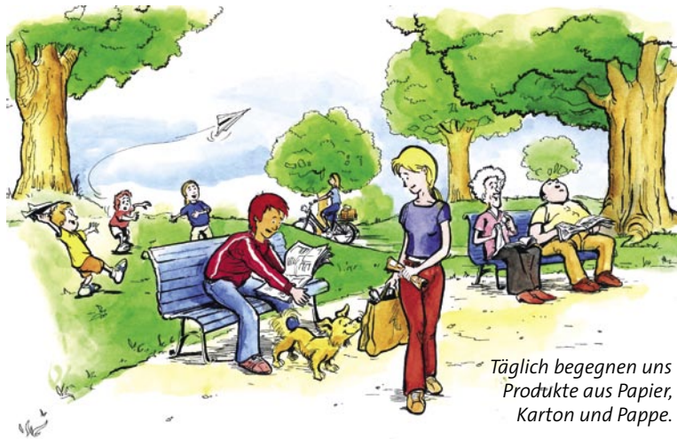
Täglich begegnen uns Produkte aus Papier, Karton und Pappe.